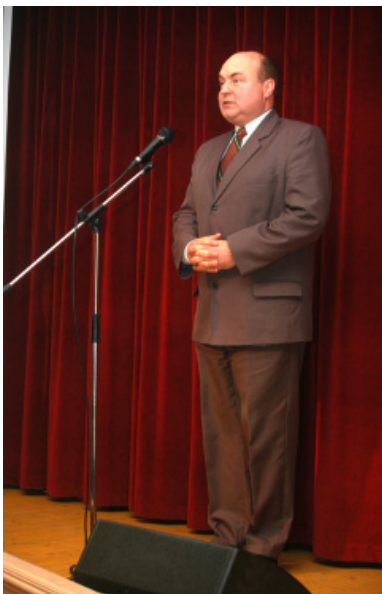
Ivanics Ferenc országgyűlési képviselő