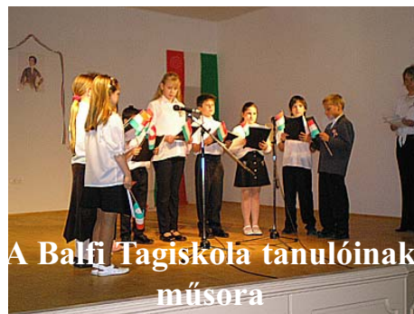
A Balfi Tagiskola tanulóinak műsora