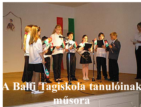
A Balfi Tagiskola tanulójának műsora