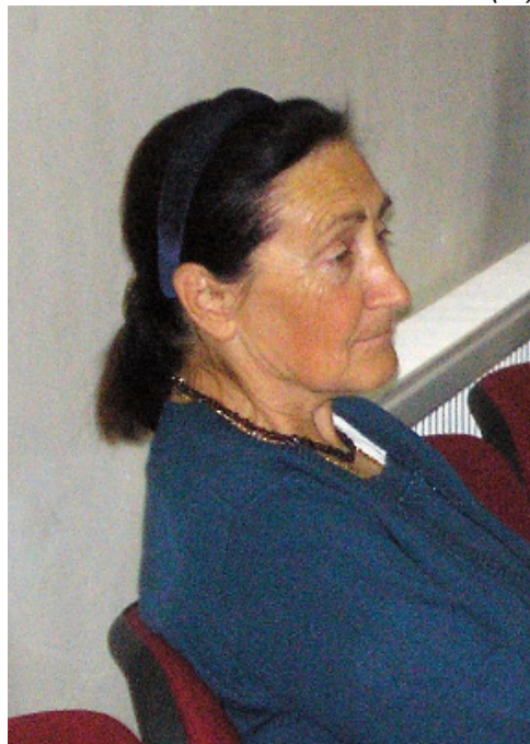
Az elnökasszony az Embermentők Emléknapján, 2010. október 16-án a kultúrházban