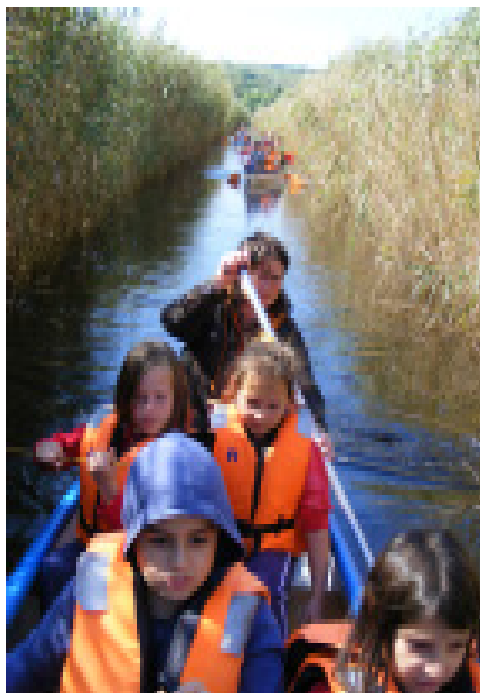
Aki a többi fotót is látni szeretné, honlapunkon megtalálja!