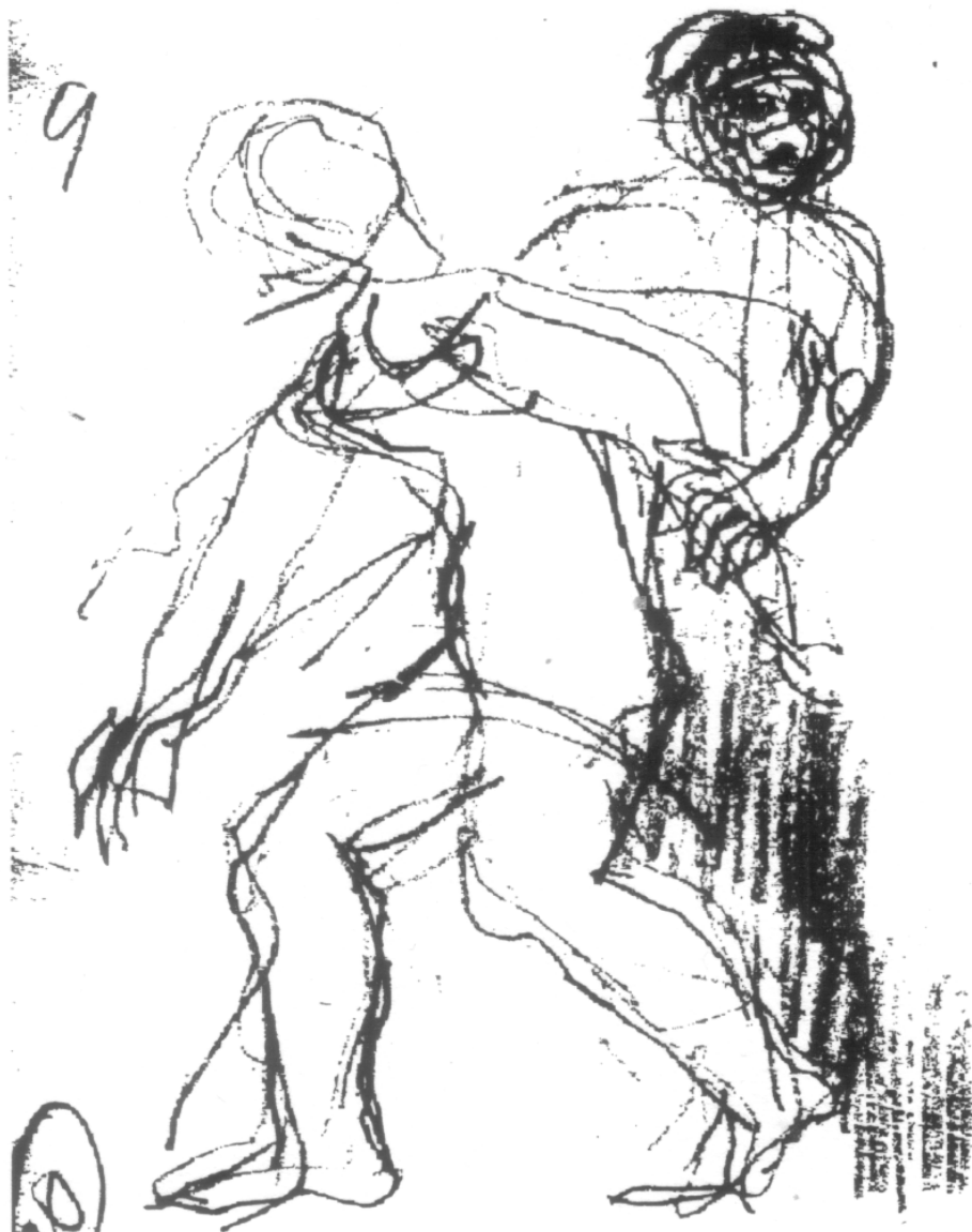
Szepes Péter grafikája